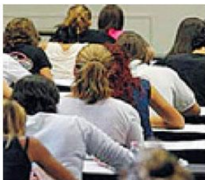
► Studio su 1936 studenti

Anche se il 29% degli intervistati si è dichiarato «molto soddisfatto» della scuola frequentata e il 57%